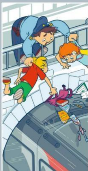
Проезд на крышах и подножках поездов — может стоить жизни!