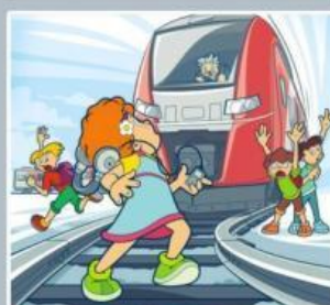
Плеер и железная дорога — несовместимы!