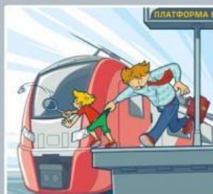
Платформа — не место для игр!