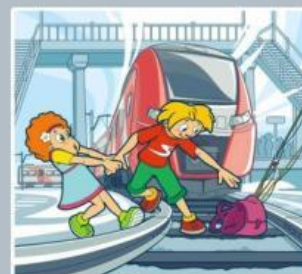
Нельзя переходить пути в неполюженном месте!