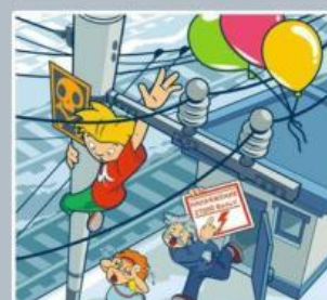
Приближаться к проводам меньше чем на 2 метра — смертельно опасно!